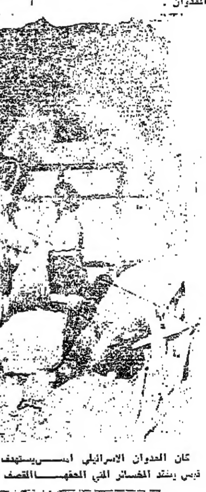
كان العدوان الاسرائيلي امس يستهدف المدنيين وهذا يقال في ام دبي يستهدف المختار المصطفى المصطفى المصطفى تصوير غلطي